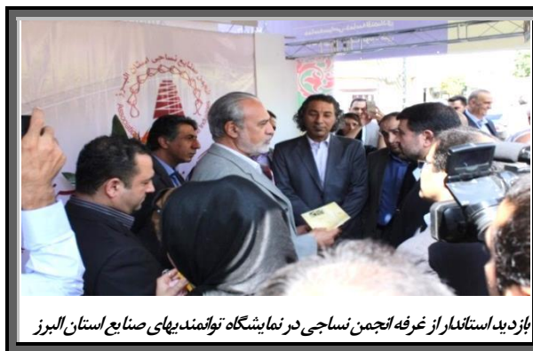
بازدید استاندار از غرفه انجمن نساجی در نمایشگاه توانمندیهای صنایع استان البرز

دبیرخانه انجمن صنایع همگن نساجی استان البرز