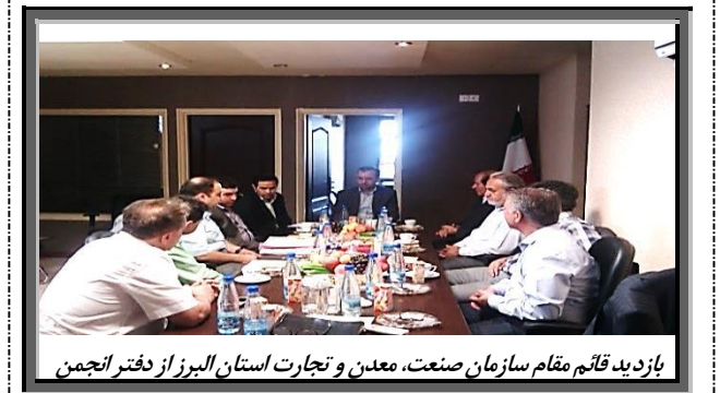
بازدید قائم مقام سازمان صنعت، معدن و تجارت استان البرز از دفتر انجمن

این انجمن که با در نظر داشتن اهدافی براساس مفاد اساسنامه خود توانست فعالیت خود را بعد از دریافت پروانه فعالیت از سازمان صنعت، معدن و تجارت به شماره ۳۱۴۱۱۰۶ مورخه ۹۲/۰۴/۰۵ به طور رسمی آغاز نماید، به لطف خداوند منان و یاری و مشارکت تولیدکنندگان گروه نساجی استان می‌تواند همچنان سرآمد و الگویی برای سایر تشکلهای و انجمن‌های صنایع همگن استان باشد.